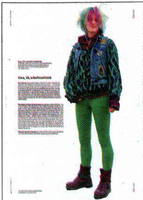
Beitrag von Scherpe für die zitty

Bloggerin einigt sich mit Medienkonzern – unter denkwürdigen Bedingungen