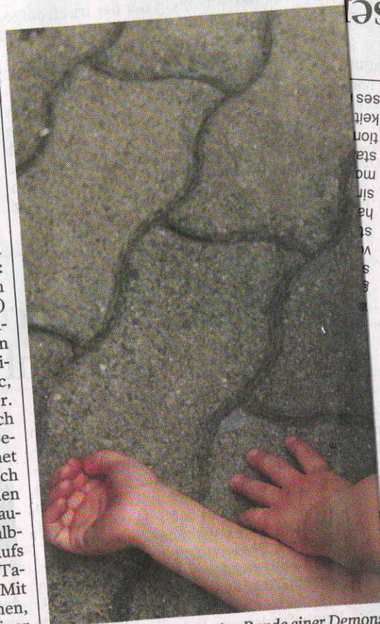
Erschöpft vom Protest. Am Rande einer Demonstration