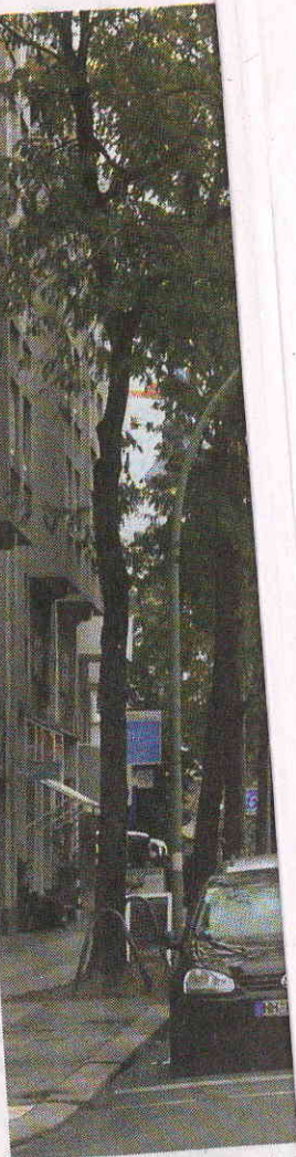
Neue Sichtachse. Nach d

Die Kita-Politik könnte in Berlin vor einem Wendepunkt stehen: Denn mit der Entscheidung des Landesverfassungsgerichtshofs, der das Kita-Plebiszit für verfassungsmäßig zulässig erklärt hat, gerät der Senat politisch unter Druck, sich mit den Forderungen des Landeselternausschusses LEAK zu beschäftigen. „Wir